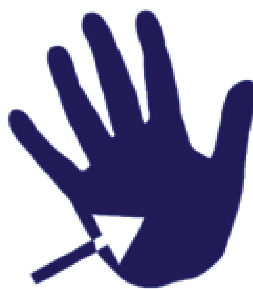
DESSUS DES MAINS