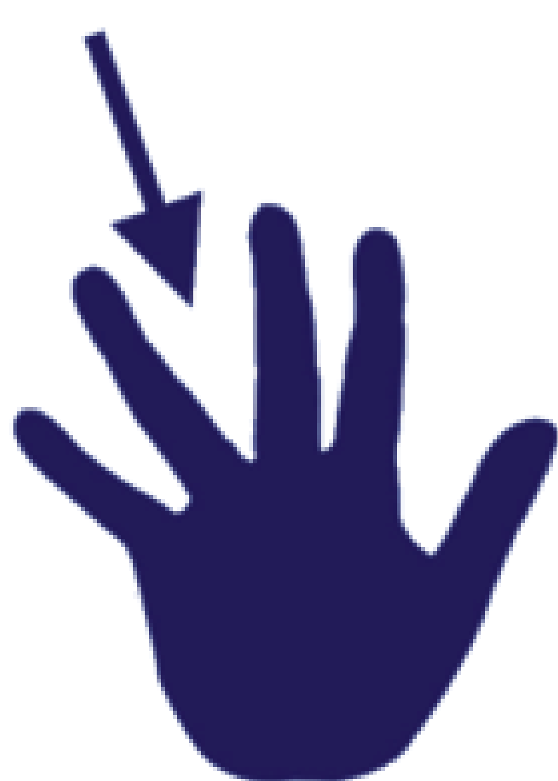
ENTRE LES DOIGTS