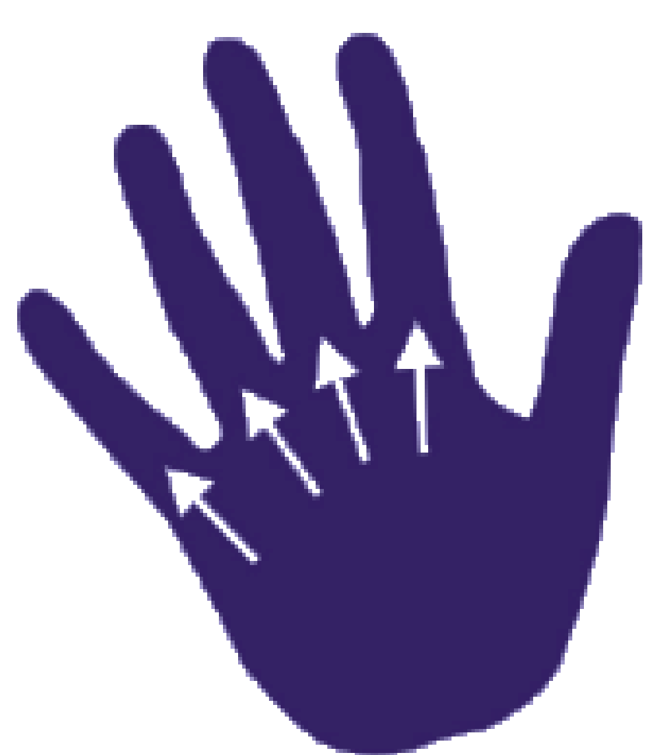
BASE DES DOIGTS