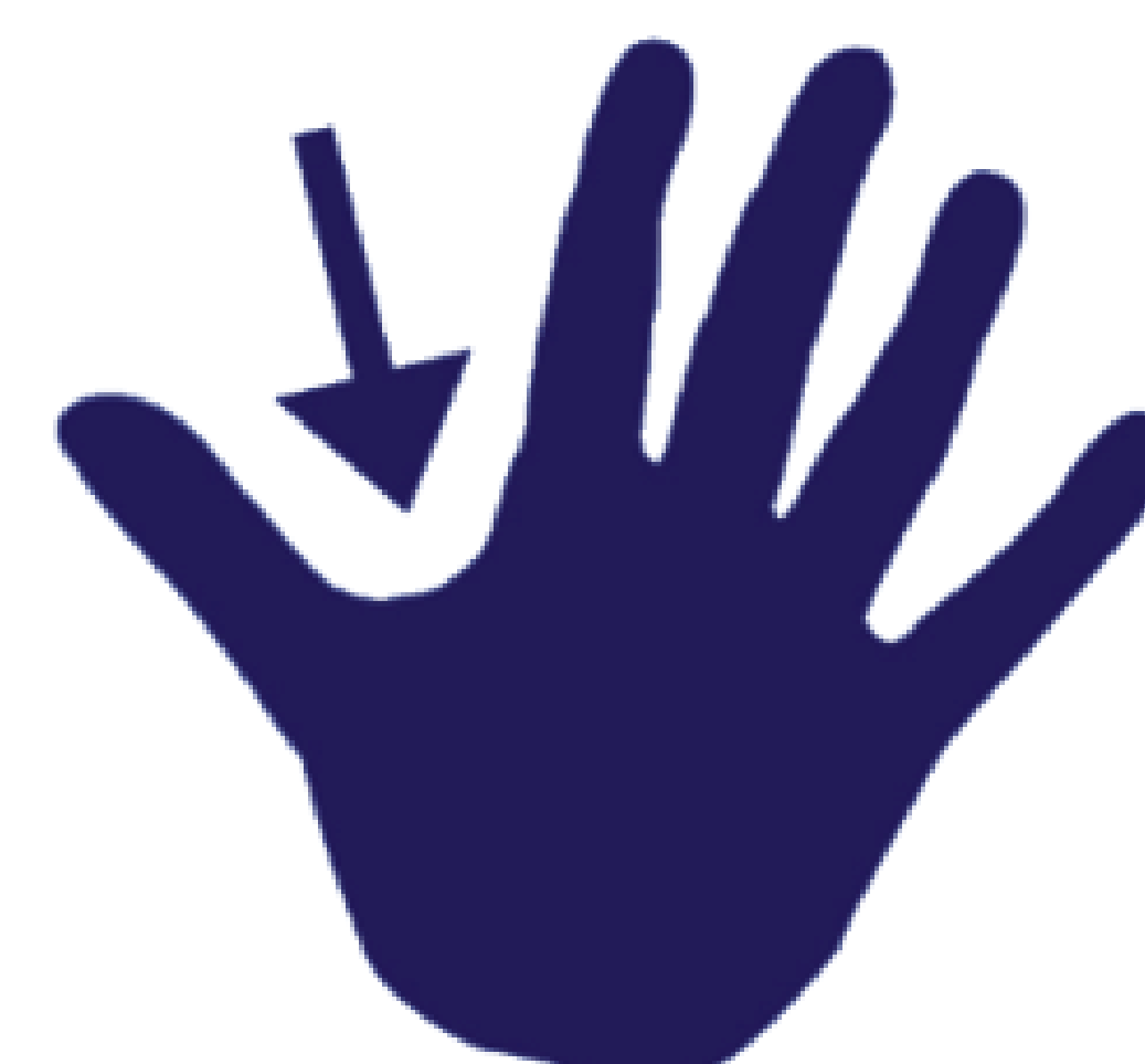
BASE DES POUCES