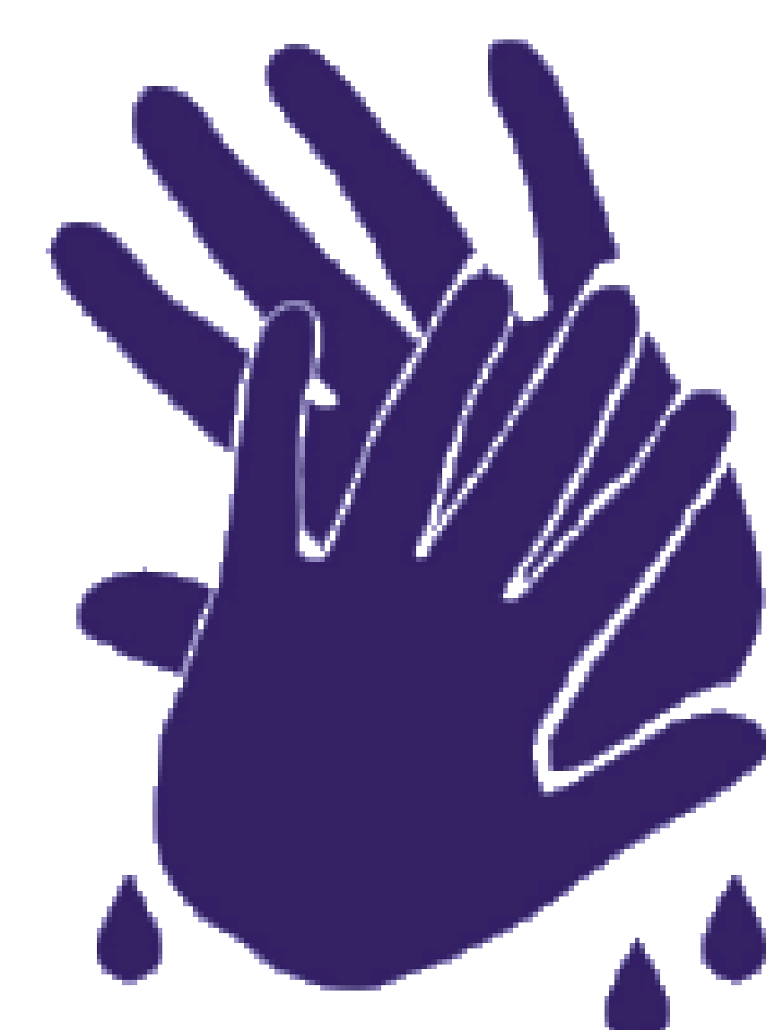
LAVEZ VOS MAINS PENDANT 20 SECONDES; RINCER ET SÉCHER