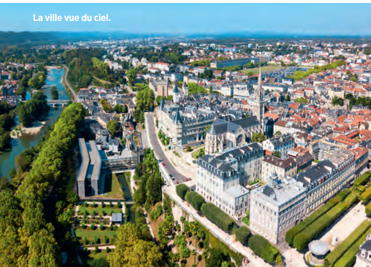
La ville vue du ciel.

établissements de santé, jusqu'à être responsable de site dans une clinique. En 2011, j'ai quitté Sodexo afin d'ouvrir un restaurant, qui m'a occupé pendant sept ans. En 2018, j'ai réintégré Sodexo comme chef de production sur le site de Total, puis chez Fareva. Sur ce site, nous formons une équipe de 4 salariés et nous préparons 120 repas par jour en moyenne. J'ai toujours mon restaurant mais, aujourd'hui, mon épouse et trois collaboratrices sont aux manettes. J'adore ma région, je suis un pur Béarnais ! Je suis né à Pau, j'y ai fait toutes mes études et j'y vis toujours. Nous avons des paysages magnifiques, avec les Pyrénées en toile de fond et l'océan Atlantique pas très loin. Les températures y sont clémentes, même l'été, c'est parfait.