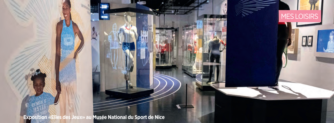
Exposition «Elles des Jeux» au Musée National du Sport de Nice