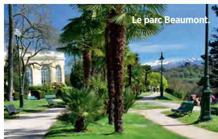
Le parc Beaumont.

Pour les amateurs, il y a de nombreuses randonnées à faire dans la région, notamment le chemin Henri IV, le GR782, qui relie Pau à Lourdes en empruntant une ancienne voie romaine. Il part d'Artiguelouve, passe par les châteaux de Pau et de Bizanos et rejoint le lac de Lourdes. On peut le faire à pied et à VTT. Côté gastronomie, nous avons la chance de vivre dans une région très riche en bons produits comme les fromages de brebis des Pyrénées, le foie gras, les confits et magrets de canard. Parmi les plats typiquement palois, la poule au pot, évidemment, mise à l'honneur par Henri IV, et la très roborative garbure, une soupe de légumes avec talon de jambon de pays, confit de canard et couenne de porc. Parfait après une randonnée !