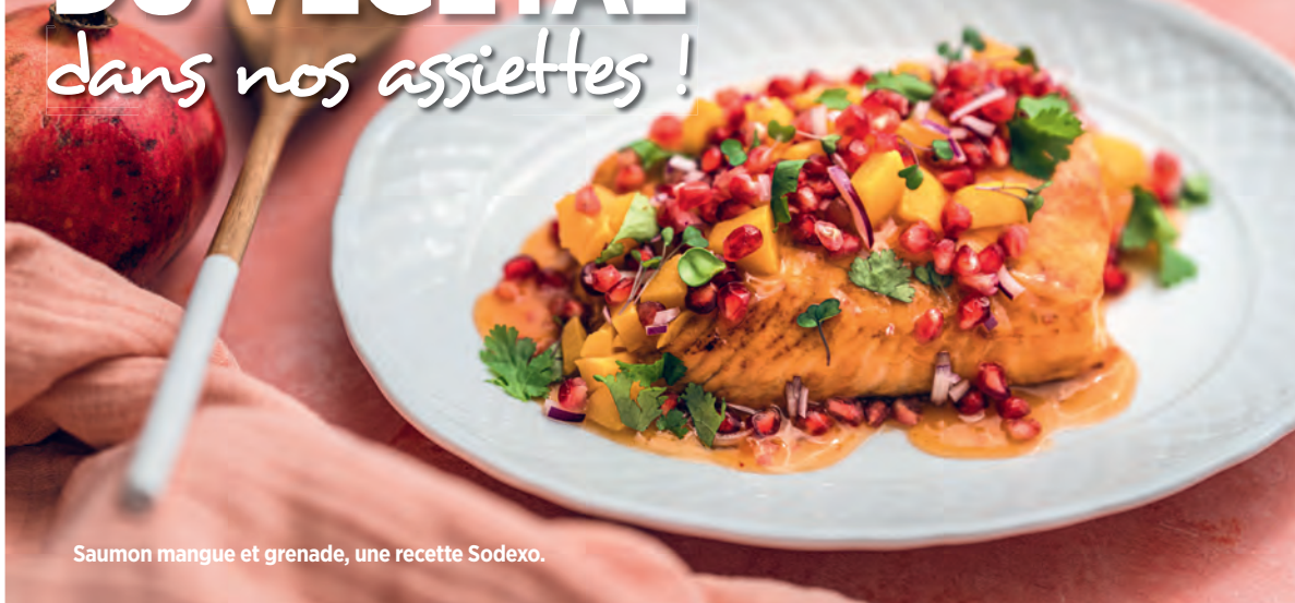
Saumon mangue et grenade, une recette Sodexo.