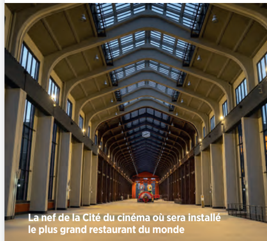
La nef de la Cité du cinéma où sera installé le plus grand restaurant du monde