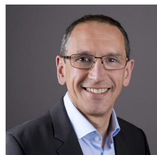
Prefácio de Denis MACHUEL:

Somos avaliados não somente pelo que fazemos, mas também pela forma como o fazemos.